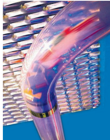
DIE PNEUMATISCHE ROHRPOST