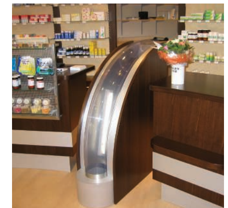
INDIVIDUELL GEFERTIGTE AUSGABESTELLEN